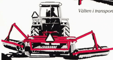
Kompaktvälten på väg att fällas ut

Arbetsläge: God följsamhet Arbetsbredd 6,4 m. eller 4,5 m