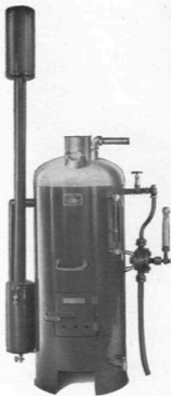
Typ SL 72 utan förvärmare, med pump.

med förvärmare är ångbildningen i full gång 6 à 7 min. efter det fyren tänts, och c:a 50-gradigt varmvatten kan tappas från varmvattenberedaren efter c:a 15 minuter.