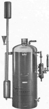
Typ SL 120 utan förvärmare, med pump.

Pannan har stor eldyta i förhållande till sin vattenvolym, varigenom snabb ångbildning erhålles. Å t. ex. typ F