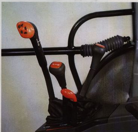
En enkel knapptryckning reducerar arbetshastigheten med 18% och ökar vridmomentet till hjulen med 22%. Ett exempel på DUALPOWER systemets fördelar i din Serie 40 SL traktor.

SYNCHROSHIFT med DUALPOWER ger Serie 40 traktorerna egenskaper med en ny dimension.