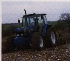
Överlappande växelområden minskar antalet spåmanövrar.

Tryck bara på en knapp när du behöver mer kraft för att köra uppför en sluttning.