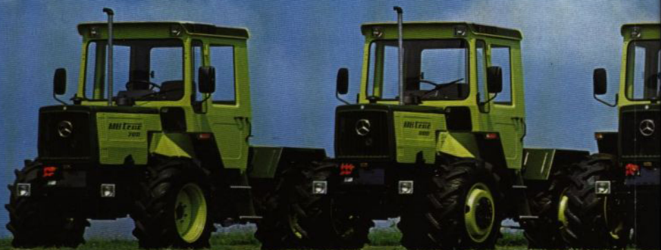
MB-trac 900 63 kW (85 hk)