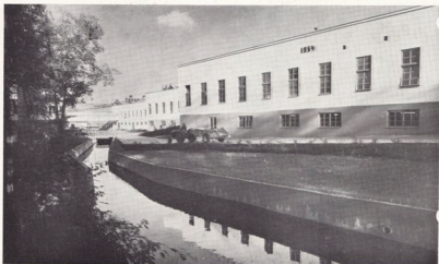
De nybyggda verkstäderna