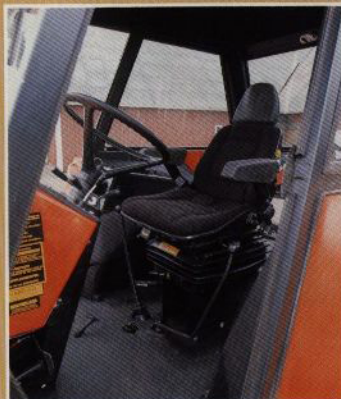
Sittkomforten och insteg är särskilt noga utformat.

Komforten i alla ZETOR-modellerna är särskilt väl tillgodosedd, bl.a. den specialkonstruerade förarstolen, rätt fördelning av reglagen, värme- och friskluftsystemet med luftväxlare och dammfilter. För att inte tala om rymden i hytten och den fantastiska runt-om-sikten.