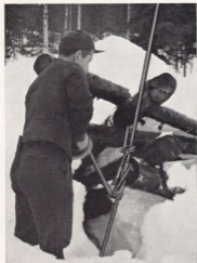
Sommarbugget virke. Snödjup 120 cm.