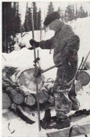
Lyft i stockände.