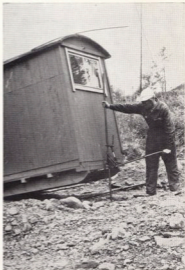
Lyft av rastkoja.