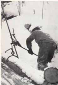
Lyft med sax.