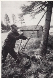
Fällriktare. Med påmonterad tryckstång.