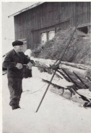
Tipping av lass.