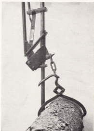
Detaljbild av lyft med sax. I saxen svetsas 3 st. \frac{1}{2} " linakar. Obs! Svetslänken bockas.