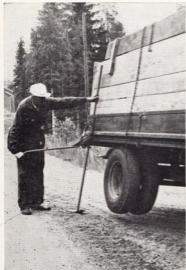
Lyft vid punktering och fastkörning.