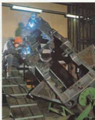
Svetsningen av ramar till Volvo BM Valmet -skotare och basmaskiner sker i speciella fityrur, s k läggeställare.