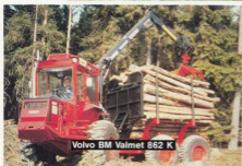
Volvo BM Valmet 862 K