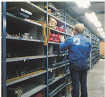
I Umeå Mekaniska AB:s lokaler finns även huvudreservdelslagret i Sverige för Volvo BM Valmet skogsmaskiner.