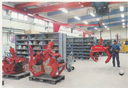
Gripprocessorn 940GP monteras till en komplett, färdig enhet.