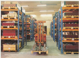
Reservdelslaget försörjer både hemma- och exportmarknader med erforderliga reservdelar.