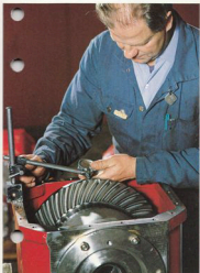
Skogsmaskinernas olika delar måste fungera ockändert. Bilden visar en kontroll under monteringen av differentialen.