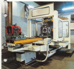
Numeriskt styrda maskiner bearbetar transmissionshus med stor noggrannhet.