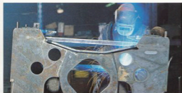
Svetsning av ramdetaljer.