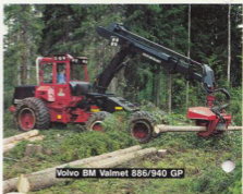
Volvo BM Valmet 886/940 GP