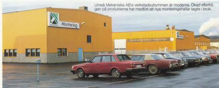
Umeå Mekaniska AB:s verkstadsutrymmen är moderna. Ökad efterfrågan på produkterna har medfört att nya monteringshallar tagits i bruk.