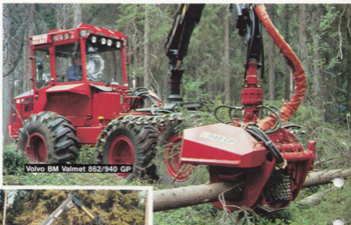
Volvo BM Valmet 862/940 GP