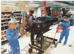
Skördarens processordel monteras komplett innan den monteras slutligt på chassi.