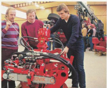
Den teoretiska och praktiska utbildningen av förare och servicepersonal sker också vid Umeå Mekaniska AB.