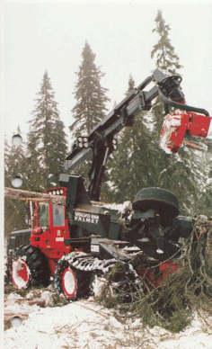
Skördarna provkörs före leverans. Provkörningen sker under praktiskt arbete.