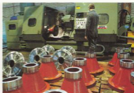
Bearbetning av bl.a axelkåpor till boggin sker med effektiva och moderna maskiner.