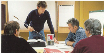
Blivande skördarförare undervisas i datorbaserad längdmätning.