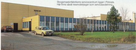
Skogsmaskinfabrikens servicecentrum ligger i Pirkkala. Här finns såväl reservdelslager som serviceavdelning.