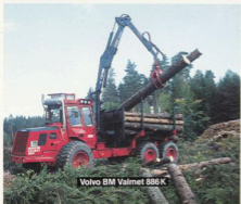
Volvo BM Valmet 886 K