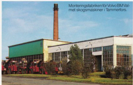
Monteringsfabriken för Volvo BM Valmet skogsmaskiner i Tammerfors.