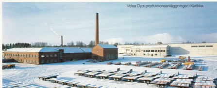
Velsa Oys produktionsanläggningar i Kurikka.