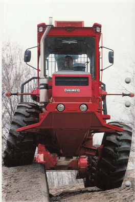
Innan maskinerna levereras till kund provkörs de på fabriken egen provbana.