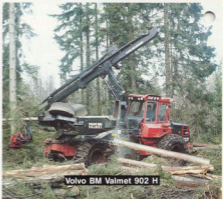
Volvo BM Valmet 902 H