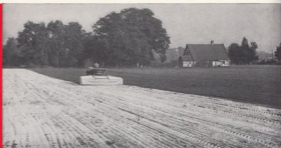
AMAZONE 2-akviga konetgödsel-spridare med dammskydd