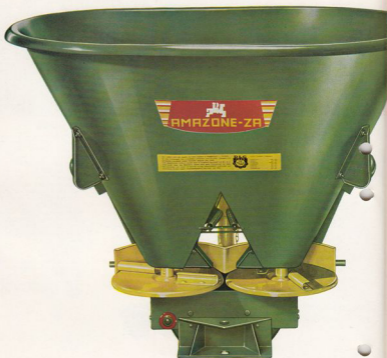
AMAZONE ZA för det medelstora och stora jordbruk