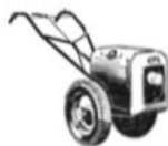
1 3/4 hkr