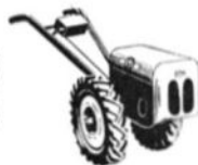
3 1/2 hkr