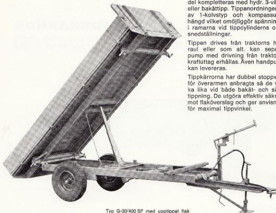
Typ G-30/400 SF med upptippat flak

Gisebo traktorkärror kan med fördel kompletteras med hydr. 3-vägs- eller bakåttipp. Tippanordningen är av 1-kolvstyp och kompassupphängd vilket omöjliggör spänningar i ramarna vid tippcylinderns olika snedställningar.