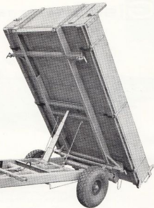
Typ G-30/350 L med upptippat flak

Tippkärrorna har dubbel stoppwire för överarmen anbragta så de verka lika vid både bakåt- och sidotippning. De utgöra effektivt säkring mot flaköverslag och ger anvisning för maximal tippvinkel.