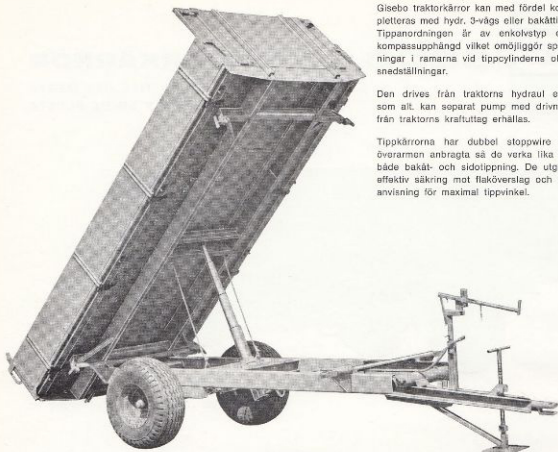
Typ G-30/400 T

Gisebo traktorkärror kan med fördel kompletteras med hydr. 3-vägs eller bakåttipp. Tippettsordningen är av enkelstyp och kompassupphängd vilket möjliggör spänningar i ramarna vid tippcylinderns olika snedställningar.