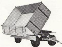
G-30/450-2 T med 3-vägstipp, sidotippad, kombinationslämmarna öppna på en sida.

Vår serie av 2-axlade vagnar har nu utökats med G-30/450-2 T (se specifikationen) byggd speciellt för 3-vägstippustrustningar. Dessa vagnar har stel ram och ledad framaxel. Tippustrustning av samma konstruktion som på våra 1-axlade och boggielärror.