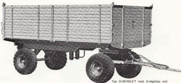
Typ G-30/450-2 T med 3-vägstipp och kombinationslämmar

ANVÄNDES TILL DET MESTA BÄTTRE ÄN DE FLESTA