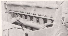
Den kraftiga matararmen och den kraftbesparande robusta Hage-dorn skäraranordningen med praktisk snabbkoppling.