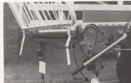
Den bakre spaken för manövrering av bottenelevatori är standard. Schnell = snabbt. Aus = ur.