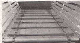
Förhöjda nedbringare av U-profil ökar avlastningskapaciteten.