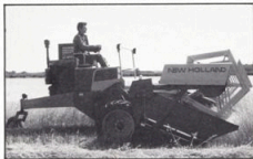
New Holland strängläggare/slättekross modell 903

"912" är försedd med hydrostatisk drivning och rattstyrning medan "910" har New Hollands beprövade planetväxeltransmission och styrspakar.