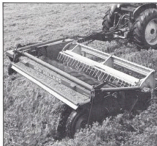
Haybine 444 slättekross