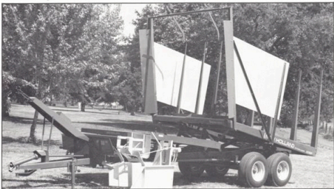
New Holland balvagn modell 1032

Båda vagnarna är robust byggda. De har varit i praktisk drift sedan flera år tillbaka och har visat sig mycket tillförlitliga och arbetsbesparande.