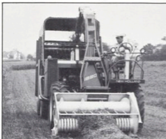
New Holland exakthack modell 1880