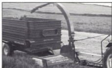
New Holland dubbelhack modell 37

New Holland har stora resurser när det gäller exakthackar, tillverkar stora serier med genomgående hög kvalitet.