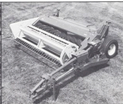
Haybine 479 slättekross