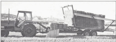
New Holland balvagn modell 1006