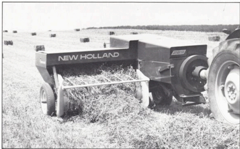
New Holland hårdpress modell 265