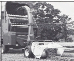
New Holland exakthack modell 717