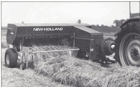
New Holland hårdpress modell 286