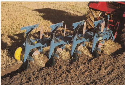
4-skärig växelplog med hydraulisk helautomatik.