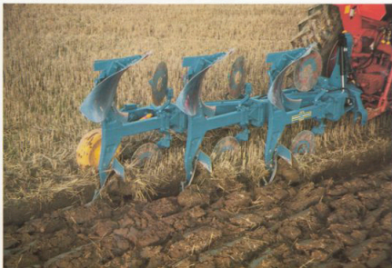
3-skärig växelplog med hydraulisk helautomatik.