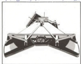
Samlarvingarnas slitstål är tillverkat av hårdast specialstål. Rätt vinkel mellan vingarna garanterar att även tung snö matas in i kastsystemet.

Runnis stadiga ram är gjord av hållbart special- och vinkelstål. Alla ståltytor är sandblästrade före målningen, vilket också bidrar till slungans livslängd. Vingaxeln är stadigt lagrad i bägge ändarna med kullager.