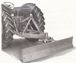
Vägsladdens skär svängt bakåt.