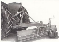
Typ THN försedd med bärhjul.