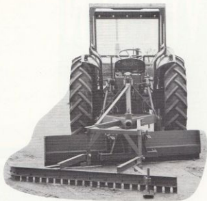
Strängspridare monterad efter 1-skärig vägladd.

Uppgiv vid beställningen vilken vägladdtyp strängspridaren är avsedd för.