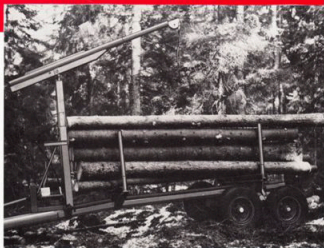
Bilden visar RM-8 boggie.