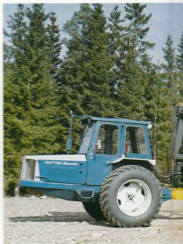
Rottne Blondin 750 har en lätt och smidig kran med rikbart torn, som ersätter extra kranutskjut, vilket skulle minska nettolyftkraften.

Rottne Blondin 750 har låg vikt, vilket ger låg totalvikt, även med full last och lågt marktryck. Skonsamt mot både vägar och terräng. Differentialspärrar på både framhjul och boggie förhindrar slirning och sönderkörning av mark samtidigt som de naturligtvis bidrar till maskinens stora framkomlighet.