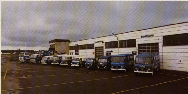
10 av våra egna servicefordon