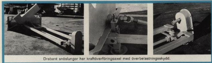
Drabant snöslungor har kraftöverföringsaxel med överbelastningsskydd.