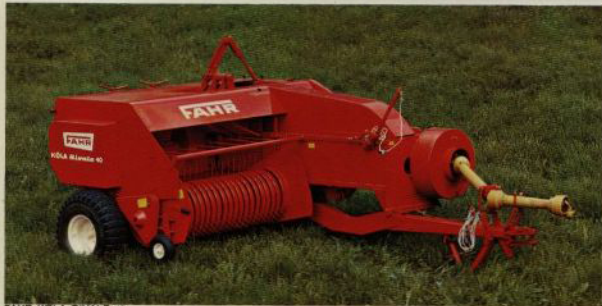
FAHR KÖLA RIVALE 40