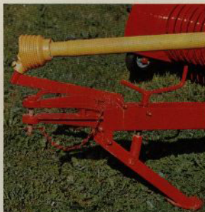
Stödföt för draget

De lättarbetande och underhållsenkla FAHR-pressarna möjliggör en rationell och ekonomisk mekanisering av hö- och halmskörden. Med FAHR-modellerna KÖLA RIVALE 20, 30 och 40 finns val-möjligheter, som passar olika jordbruks-arealer och maskinstationer.