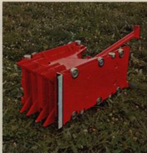
Presskoiv med rullar