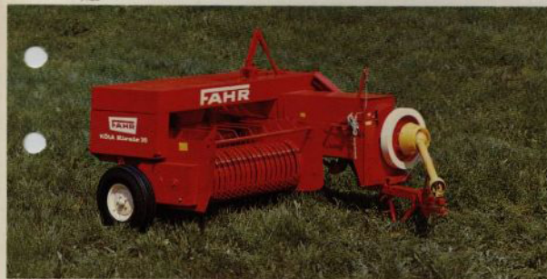
FAHR KÖLA RIVALE 20