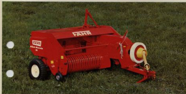
FAHR KÖLA RIVALE 30