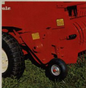
Stöd-hjul för pickup