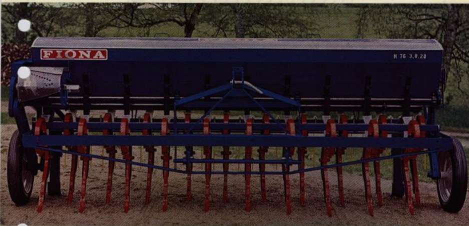
FIONA harvsåmaskin H-76 — arbetsbredd 3,00 m med 20 kultivatorpinnar och sårör

Tre maskiner i en — harv, konstgödselspridare, såmaskin Exakt nedmyllning av granulerad konstgödsel Större och säkrare skörd