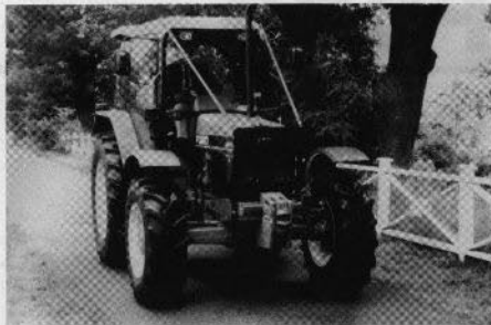
Ford Serie 40 Skog - den idealiska traktorn för skog och jordbruk.

Med FORDs nya skogsutrustning kan du öka din lönsamhet genom att göra jobbet själv!