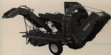
V2RE i arbetsläge