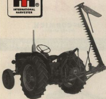
Ovan: S4-1 i transportläge