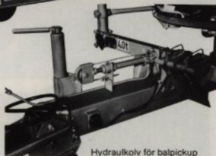
Hydraulkolv för balpickup är standard i Sverige.

Provad vid Statens Maskinprovningar enligt meddelande 2356.