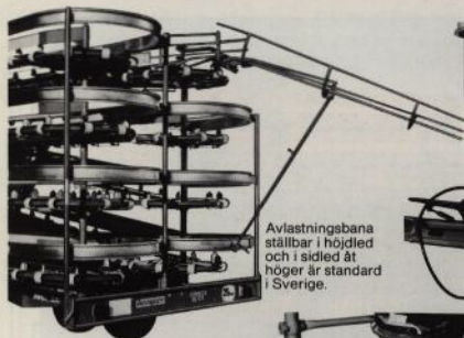
Avlastningsbana ställbar i höjdlöd och i sidled åt höger är standard i Sverige.

passar för alla gårdstorlekar samt för maskinstationer (BE 125). EXPRESS BE 75 lastar upp till 75 balar, BE 95 upp till 95 balar och BE 125 upp till 125 balar.