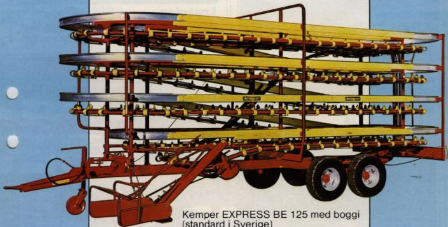
Kemper EXPRESS BE 125 med boggi (standard i Sverige)