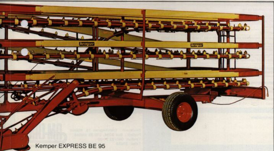
Kemper EXPRESS BE 95