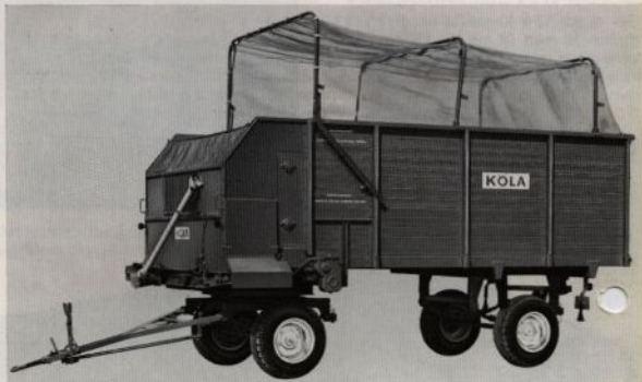
Självavlastande vagn ASW 40-special