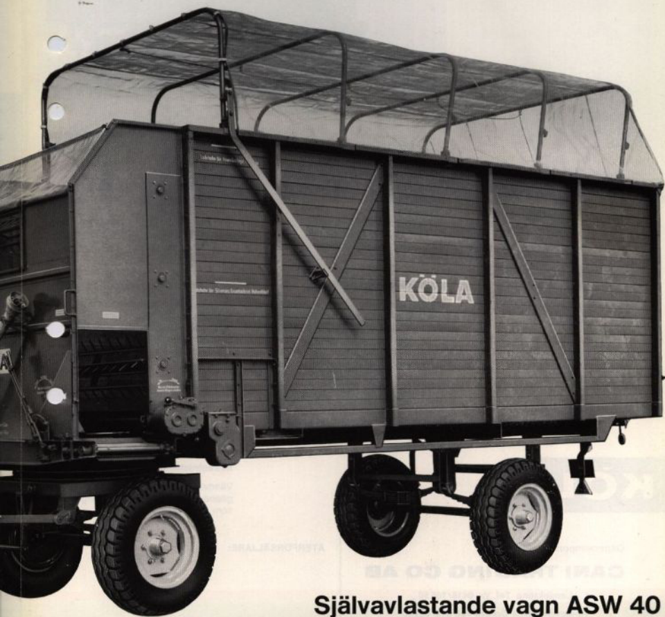
Självavlastande vagn ASW 40

Således kan KÖLA självavlastande vagn användas även för fyllning av plansilos. Denna växellåda är standard på ASW 40 och kan erhållas som extrautrustning till ASW 40-special. Genom ett siktfönster på främre gaveln kan lastningsmängden lätt kontrolleras. KÖLA självavlastande vagn kan överta en stor del av de transportarbeten, som finns på varje gård.