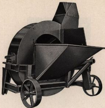
TRANSIT silofläkt med kort inmatningstråg (rekommenderas endast tillsammans med självavlastande vagn).

Den sedan många år i praktiken väl beprövade silofläkten TRANSIT är utrustad med en mer än tre meter lång och med transportkedja försedd inmatningstransportör. Tack vare den stora transportkapaciteten lämpar den sig utmärkt för fyllning av höga silos. Det hackade materialet går från uppsamlingsvagnen i en kontinuerlig ström via transportkedjan till fläkten. Då materialet vid fälthackning packas mycket hårt i uppsamlingsvagnen erfordras en viss fördelning och en jämn inmatning i silofläkten. Detta åstadkommes av den i inmatningsöppningen placerade fördelaren, vilken roterar i motsatt riktning till inmatningskedjan.