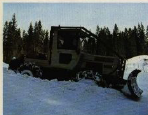
MB-trac som dragare i skogen.