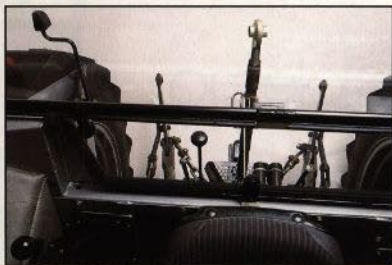
Bättre sikt bakåt och åtkomlighet till hydraulen

Det enda sättet att till fullo uppskatta den nya HiLine-serien är att göra ett besök hos Din lokala M-F-handlare, där Du kan titta närmare, vi vet att Du kommer att tycka om det Du ser.