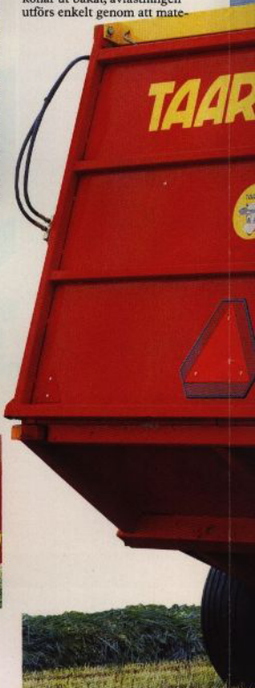
Vagnkorgens speciella utformning betyder avlastning utan bottenkedjor.

Hela snittsystemet består endast av en roterande enhet, nämligen snitt/komprimeringsrotorn. Avlastningen utförs utan bottenkedjor. Vagnens botten och sidor konar ut bakåt, avlastningen utförs enkelt genom att mate-