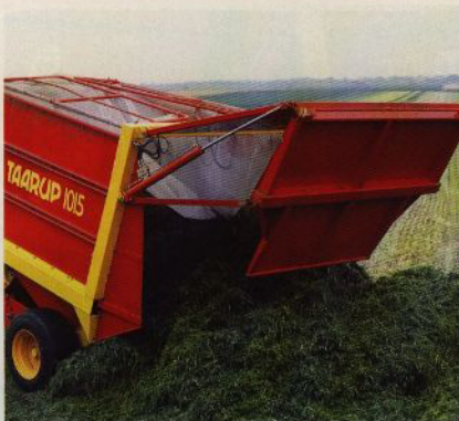
Materialet faller lätt ut ur vagnen, bakluckan öppnas och vagnen tipsas med hjälp av traktorns 3-punktskoppling.

Snittlängden bestäms genom att ändra knivavtalet.