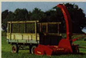
Taarup DC 1500 dubbelhack i kombination med 4-axlad vagn.