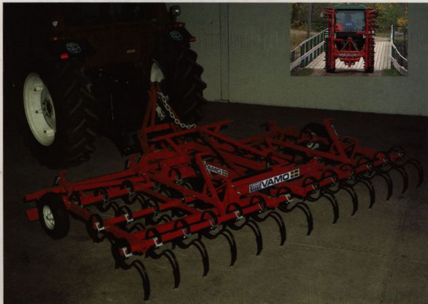
Vamo HH-hjul 3,7 m