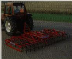
Vamo HH-med 4,3 m

hjulspår, och hjulens placering ger en garanterat jämn och stabil gång, även utan stabiliserande extra tillbehör. Hjulen föser aldrig lös jord framför sig. Hydraulharven finns även med medar som bärorgan.