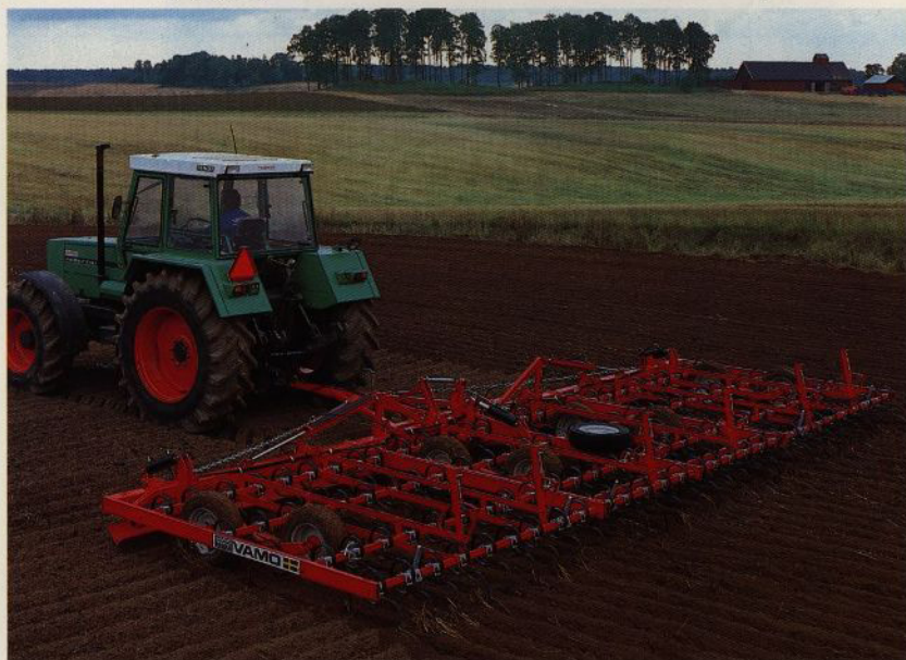
Vamo Exakt 8,5 m