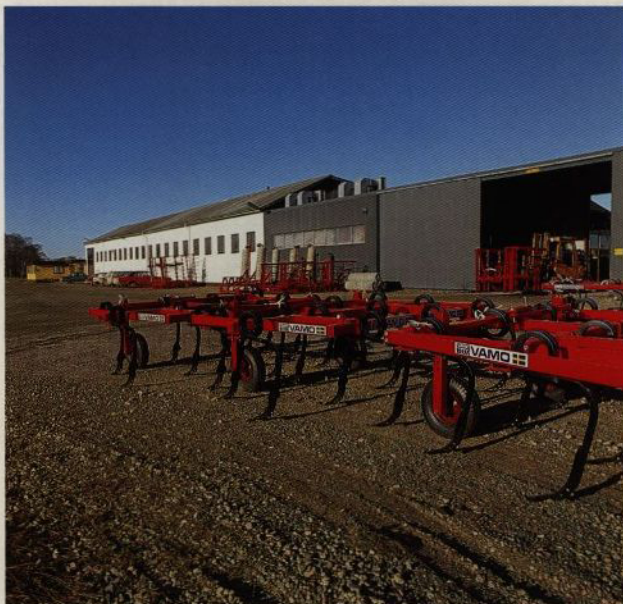
Vamo har fabriker i Larv och Kvänum på Västgötaslätten. Bilden visar anläggningen i Larv

VAMO tillverkar sedan 1950-talet jordbruksredskap. Idag består produktsortimentet av jordbearbetningsmaskiner för hela årscykeln från såbäddsberedning till stubb-bearbetning. De effektiva redskapen med i många fall avancerade tekniska lösningar svarar mot lantbrukarens krav och underlättar hans arbete.