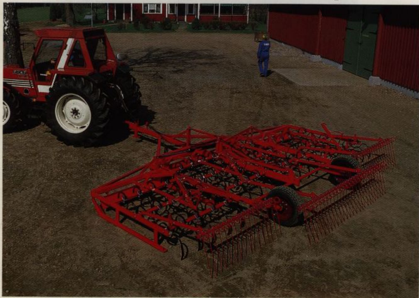
Vamo BMH 5,5 m med efterharv