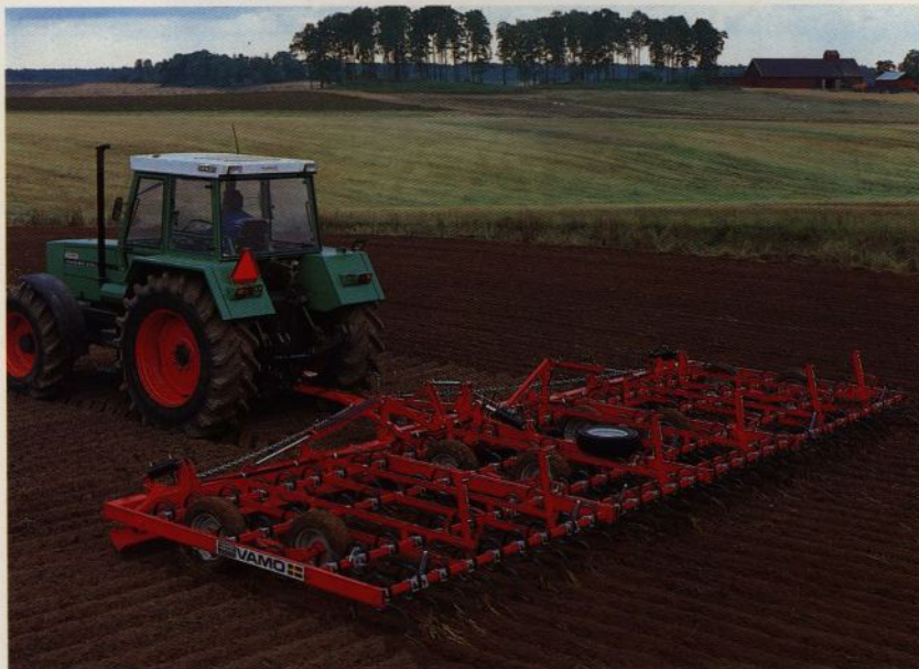
Vamo Exakt 8,5 m