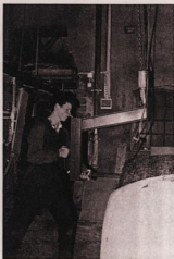
lastning sker med hjälp av en spjutlyft.