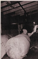
Inkörning och lagring av ett antal balar är en stor fördel.