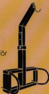
Lyftbygel för storsäck