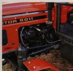
Servostyrning som standard. Inbyggd kompressor.