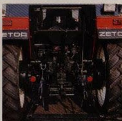
Överdimensionerat kraftcentrum med hitchkrok som standard.