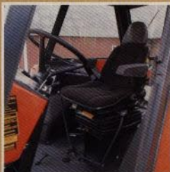
Sittkomforten och insteget är särskilt nogra utformat.