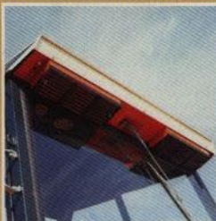
Inbyggt värmesystem med lufffilter. Plats för radio och högtalare. Dammfilter.