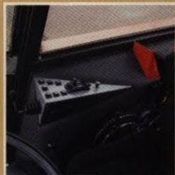
Reglagen i Zetor-traktorerna är funktionsriktigt placerade.