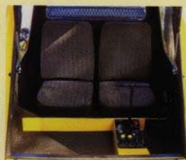
Bekväm hytt för två personer.