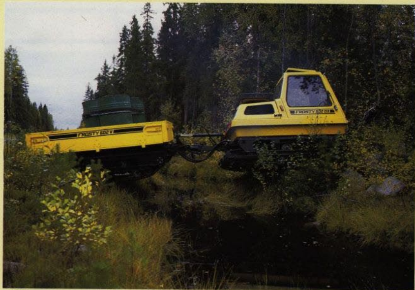
FROSTY med driven vagn. Vid dikesövergång utnyttjas den hydrauliska stödbommen.