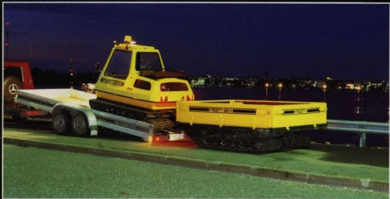
FROSTY med DRIVEN VAGN lastas och lossas enkelt från ex. trailer.