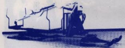
GRIPLASTARCHASSI för ex. Vaksaladoning