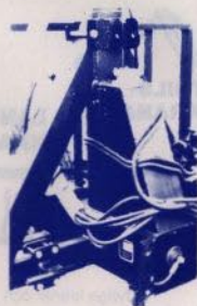
TREPUNKT för mindre traktor