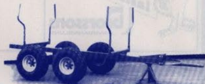
BOGGIEVAGN 3 ton