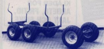
HÄSTVAGN 6 hjul