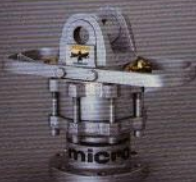
MICRO: Lätt rotator med agenskaper som gör den lämplig för alla kranar i den professionella skogshanteringen.