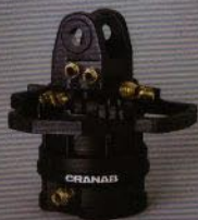
GV 10-104: Rotatorn finns utrustad med två extra svivelkanaler för arbeten med gripsåg och fällgripsåg.