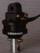
FR 1: Liten runtomsvängande rotator för små kranar.