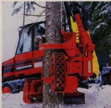
Det gäller att nå långt. Nokka Harvester faller exakt.

Nokka gallringsmaskin är den verkliga multifunktionsmaskinen i skogen.