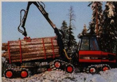
Det finns mycket att transportera – oavsett terräng och ändå på skogens villkor. Med Nokka Joker 24 WD – stadigt och säkert.