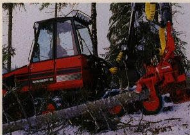
Det finns mycket som skall kapas – och allt skall först kvistas. Med Nokka Harvester går det helt automatiskt.