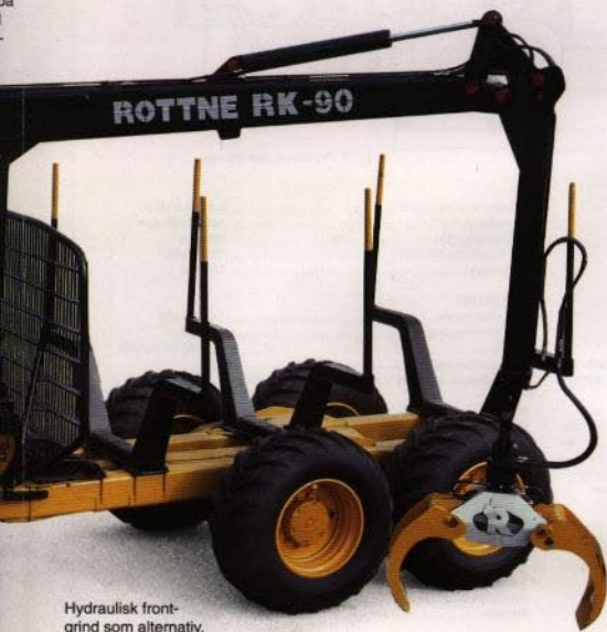
Hydraulisk frontgrind som alternativ.