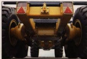
Genomtänkt boggikonstruktion ger suverän frigångshöjd. Bakre vagnsramen demonterbar.

Maskinen är standardutrustad med 20,5x25. Som alternativ finns 25/65x25 samt lågprofilsdäcken 600 eller 700x30,5 för god bärighet utan band.