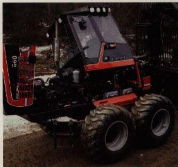
Service- och bromsventiler är placerade i var sitt block. Serviceömkomligheten är mycket god.

Som standard är 860 utrustad med Cranab 650, men behöver du en ännu kraftigare kran finns Cranab 800. Oavsett vilken du väljer får du en kran med bra svep, hög lyfthöjd och lång räckvidd.