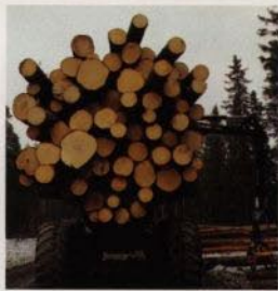
Lastkapaciteten är imponerande.