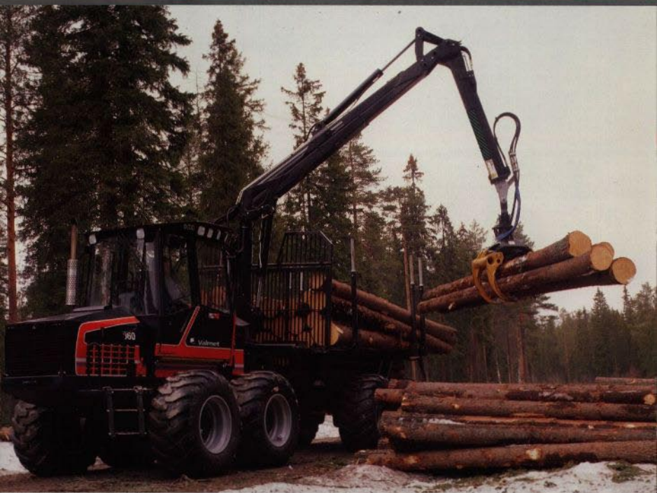
...n under lastning och lossning är perfekt.