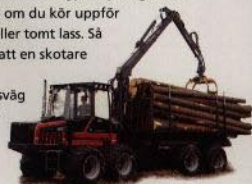
I norrländska förhållanden fungerar detta kraftpaket utmärkt även i senare gallringar.

Håll med om att D.T.C är något alldeles extra.