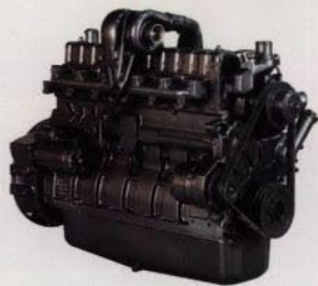
Motorn är en sensation: Stark, tyst, bränslesnål och med avgasutsläpp långt under europeiska gränsvärden.