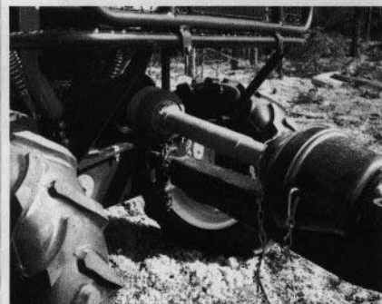
Kraftuttag, varvtals-och drivhjulsbberoende