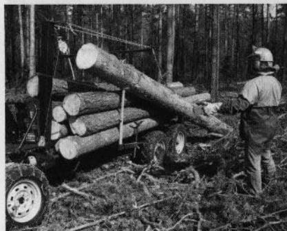
Wirekran för timmer