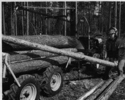
Lastvipa för massaved